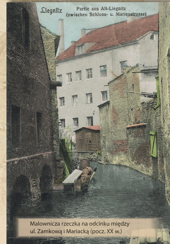
Malownicza rzeczka na odcinku między ul. Zamkową i Mariacką (pocz. XX w.)