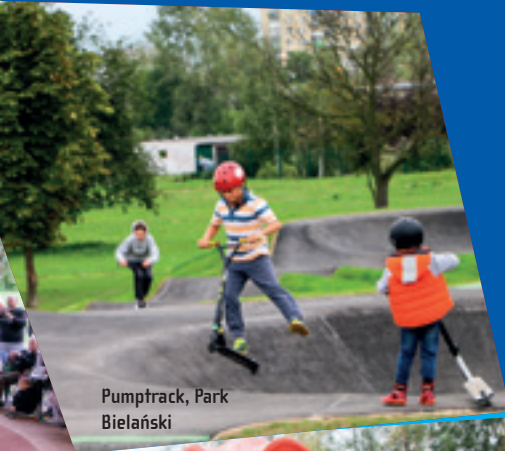
Pumptrack, Park Bielański