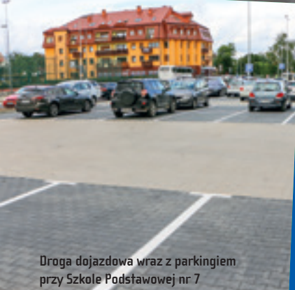
Droga dojazdowa wraz z parkingiem przy Szkole Podstawowej nr 7