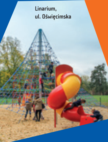
Linarium, ul. Oświęcimska