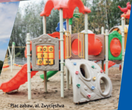
Plac zabaw, al. Zwycięstwa