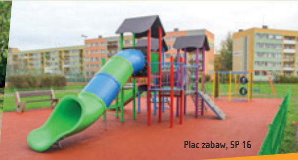
Plac zabaw, SP 16