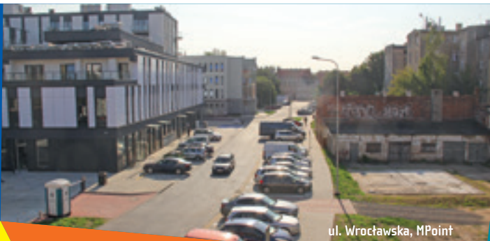
ul. Wrocławska, MPoint