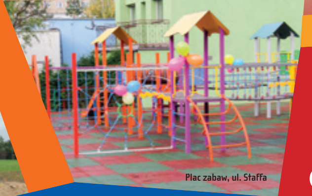
Plac zabaw, ul. Staffa