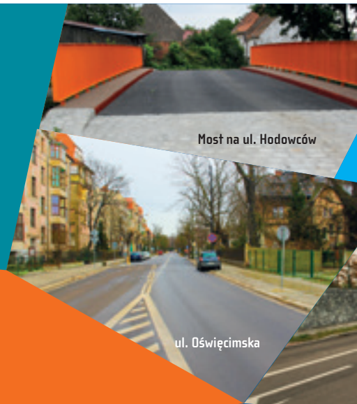
Most na ul. Hodowców