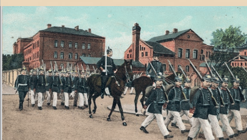
Skrzyżowanie dzisiejszych ulic Hutników i Nowy Świat. W 1904 r. taki widok był codziennością.

Budowę pierwszego skrzydła (z cegły wyprodukowanej w cegielni Gottfrieda Bienwalda przy obecnej ul. Kilińskiego), położonego frontem do ulicy, rozpoczęto w 1874 r., a zakończono w 1877 r. Uroczystość otwarcia koszar odbyła się, z udziałem cesarza, w kasynie oficerskim. W budynku zakwaterowano żołnierzy I batalionu. Koszarowiec dla II batalionu, leżący wzdłuż ul. Sejmowej, budowano w latach 1879-1881. Żołnierze wprowadzili się do niego 21 września 1881 r. Rok później - 13 września 1882 r., zakończono budowę trzeciego gmachu. W budynku zakwaterowano na stałe batalion fizylierów, dotychczas stacjonujący w Lwówku Śląskim. W latach 1893-