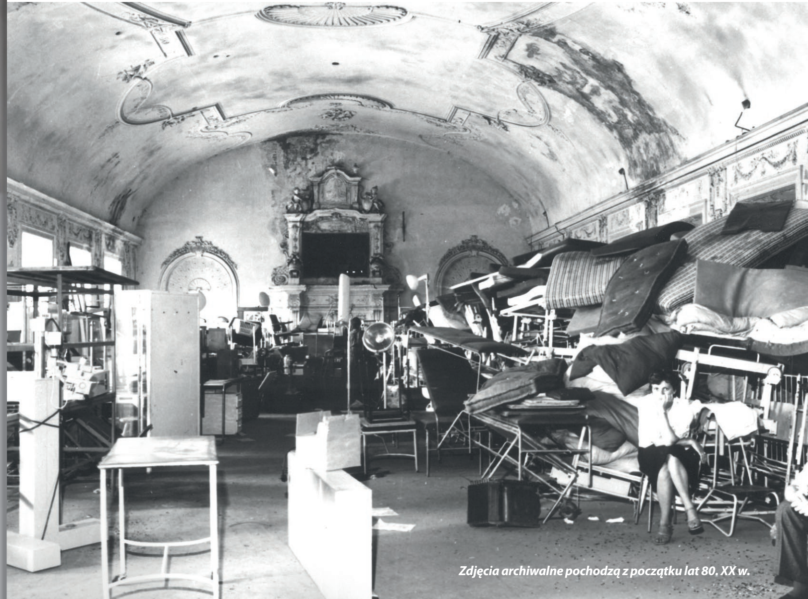
Zdjęcia archiwalne pochodzą z początku lat 80. XX w.

Od wielu lat ogromnymi nakładami i wysiłkiem gminy, Akademia jest remontowana i modernizowana. Znaczne przyspieszenie prac nastąpiło w ostatnich latach, kiedy prezydent Legnicy uznał to zadanie za jeden z priorytetów inwestycyjnych miasta. Co roku oddaje się do użytku kolejne części – piętra i skrzydła obiektu, włączając je do miejskiej infrastruktury kulturalnej. Na przywrócenie świetności gmachu wydano ponad 49 mln zł, głównie z budżetu miejskiego. W ciągu ostatnich dwóch lat miasto przeznaczyło na ten cel ok. 10 mln zł.