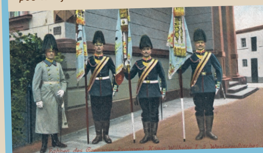
Grenadierzy królewscy ze sztandarami na karcie pocztowej z 1914 roku.

1897 dołączył czwarty batalion, a w 1909 r. także oddział karabinów maszynowych. Garnizonowy lazaret przy dzisiejszej ul. Chojnowskiej został ukończony w 1877 r.