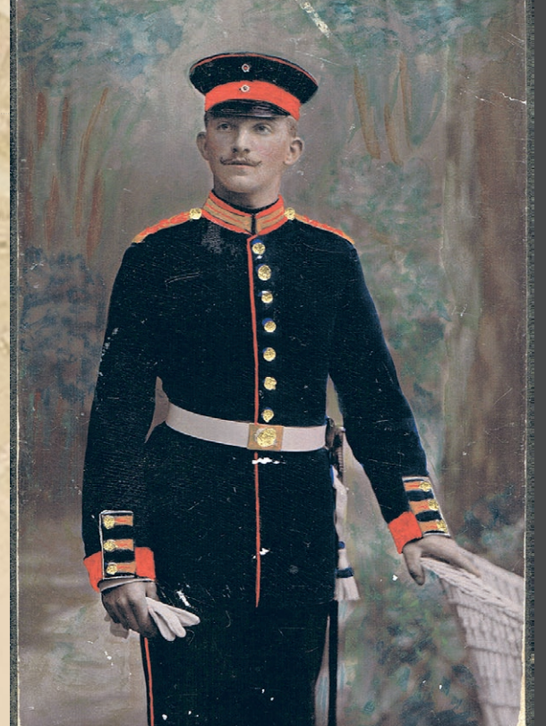
Hansen Liegnitz, Ring 25

Legniccy grenadierzy brali udział w wojnach: prusko-austriackiej (1866), prusko-francuskiej (1870-1871) i I wojnie światowej (1914-1918). Podczas pierwszej z nich, pod koniec czerwca, regiment uczestniczył w walkach pod Nachodem i Czeskimi Skalicami (Skalitz). Szczególnie druga bitwa tragicznie zapisała się w historii pułku, zginęło wówczas 22 oficerów i 463 żołnierzy. W działaniach wojennych pomiędzy Prusami a Francją w latach 1870-