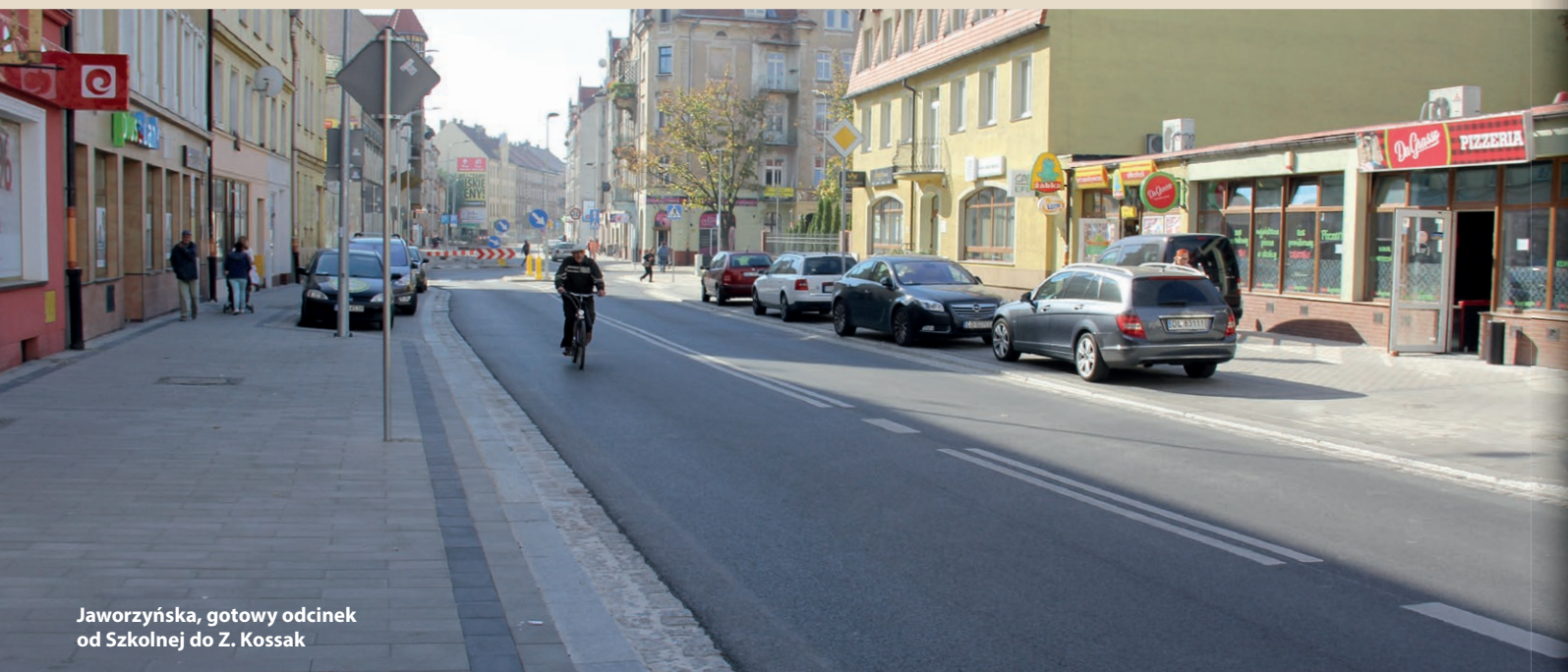
Jaworzyńska, gotowy odcinek od Szkolnej do Z. Kossak

tę funkcję MKS Miedź Legnica zastąpi Młodzieżowe Stowarzyszenie Piłki Ręcznej Siódemka. Rada wybrała również 41 ławników do legnickich sądów Rejonowego i Okręgowego na kadencję 2016-2019.