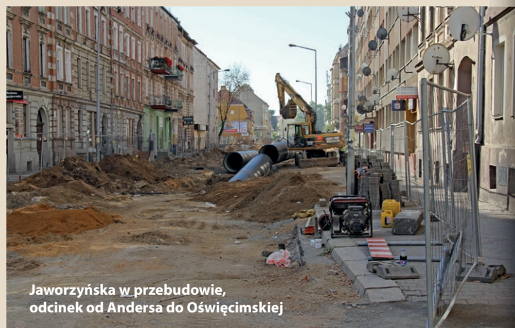
Jaworzyńska w przebudowie, odcinek od Andersa do Oświęcimskiej

Rada Miejska podjęła uchwałę o zmianie inkasenta obsługującego targowisko przy al. Zwycięstwa. Pełniący dotychczas