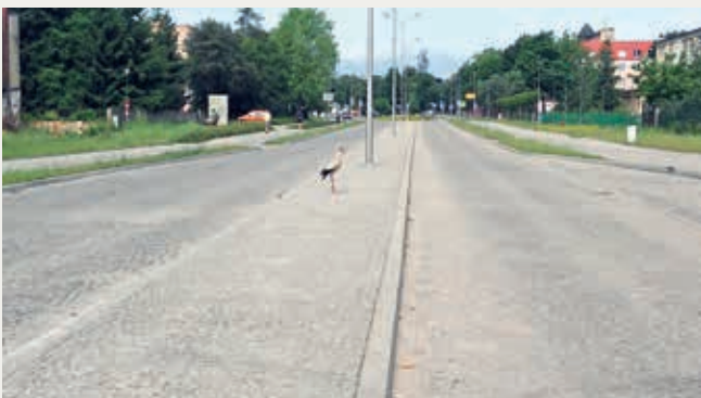
Czyżby inspektor nadzoru po przebudowie ul. Grabskiego?