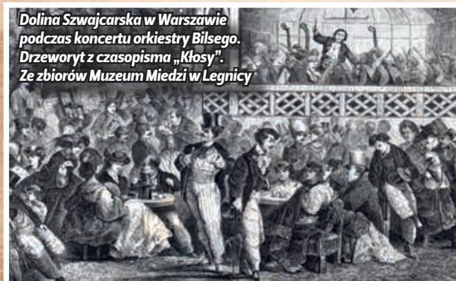
Dolina Szwajcarska w Warszawie podczas koncertu orkiestry Bilsego. Drzeworyt z czasopisma „Kłosy”.

zdołali sławę, koncertując w 1867 r. podczas Wystawy Światowej w Paryżu. Wyróżnikiem legnickiego dyrygenta i jego orkiestry stały się doskonałe prezentacje utworów zarówno muzyki symfonicznej jak i popularnej. Krytyka podkreślała szczególnie świetne wykształcenie muzyków Bilsego, wzorcowe współdziałanie różnych grup instrumentów, wspaniałe dźwięk smyczków i instrumentów dętych. To były atuty gwarantujące doskonałą interpretację najważniejszych dzieł muzycznych. W samym Berlinie Bilse dał ponad