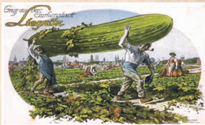
Karta pocztowa – Pozdrowienia z Legnicy – miasta ogórków