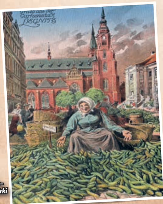
Karta pocztowa z pozdrowieniami – ogórki na Rynku

MUSZTARDOWE OGÓRKI: pokroić 0,5 kg grubych ogórków, odrzucić ogonki, dobrze posolić. Zostawić na 12 godzin w misce. Ponownie przygotować bolesławiecki garnek lub słoik. Warstwami ułożyć dobrze odsączone ogórki, ziarna gorczycy, estragon, pokrojony cienko korzeń chrzanu, pierścienie cebuli. W międzyczasie dodać ocet (2/3 octu, 1/3 wody), 2 łyżki cukru do smaku, 10–15 aromatycznych ziaren ziela angielskiego, 3–4 liście laurowe, trochę papryki (jeśli ma się życzenie). Istnieje także gotowa przyprawa „doktor ogórkowy” do ogórków, wówczas gotuje się tylko trochę octu z cukrem i gorącym zalewa ogórki. Zostawić na 3 dni, następnie odlać ocet, jeszcze raz zagotować i jak wyżej – zalać „doktorem ogórkowym”, przykryć papierem, wstrząsnąć i zawiązać.