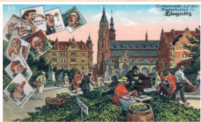
Targ ogórkowy na dzisiejszym placu Słowiańskim (dawny Friedrichsplatz)