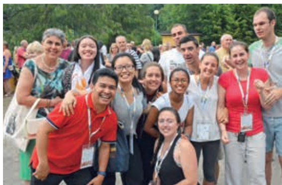
FOT.: KS. WALDEMAR WESOŁOWSKI