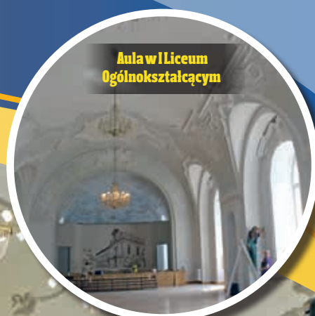
Aula w Liceum Ogólnokształcącym