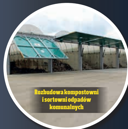
Rozbudowa kompostowni i sortowni odpadów komunalnych

Projekt obejmuje dziewięć zadań. Planowany koszt jego realizacji wynosi 33 mln zł, a kwota dofinansowania to prawie 17 mln zł. Projekt jest finansowany przez Unię Europejską ze środków Funduszu Spójności w ramach Programu Operacyjnego Infrastruktura i Środowisko na lata 2014–2020.