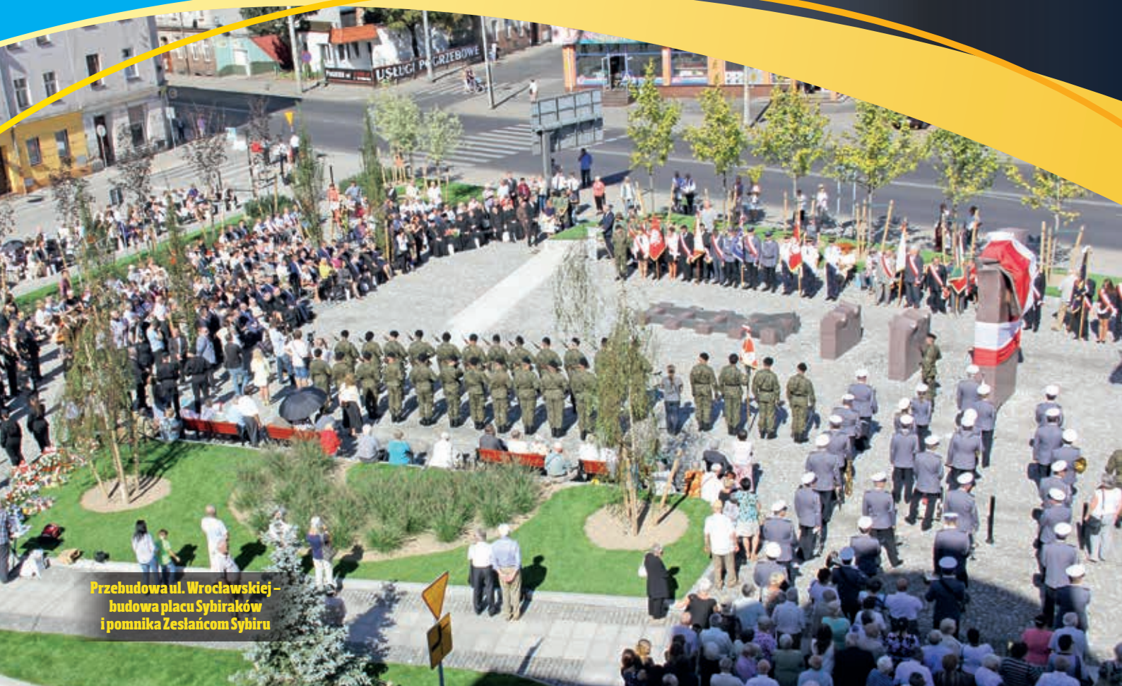
Przebudowa ul. Wrocławskiej – budowa placu Sybiraków i pomnika Zesłańcom Sybiru

Na ul. Sikorskiego została wymieniona konstrukcja jezdni, chodników i ścieżek rowerowych. Zbudowano rondo typu turbinowego na skrzyżowaniu ul. Sikorskiego z lwaskiewicz i dodatkowy pas ruchu dla pojazdów skręcających w prawo z ul. Sikorskiego w ul. lwaskiewicz. W ramach tego zadania zbudowano też nowy przystanek autobusowy tuż za