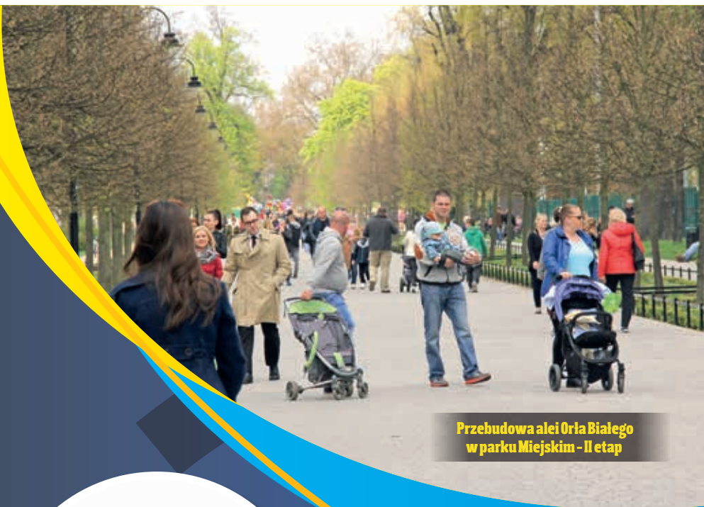
Przebudowa alei Orła Białego w parku Miejskim – II etap

Przebudowa al. Orła Białego była podzielona na dwa etapy. W pierwszym, zakończonym w 2014 r. wykonano prace na odcinku od ul. Powstańców Śląskich do al. Białej.