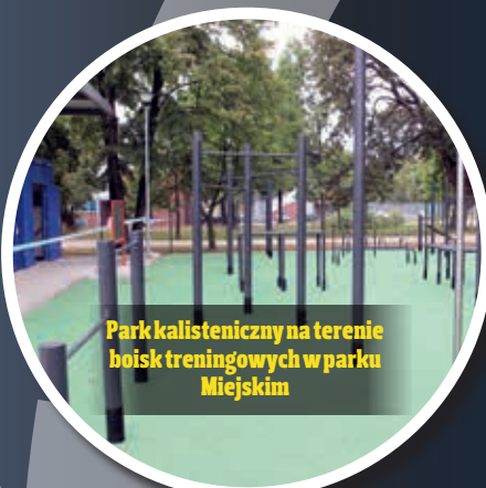
Park kalisteniczny na terenie boisk treningowych w parku Miejskim