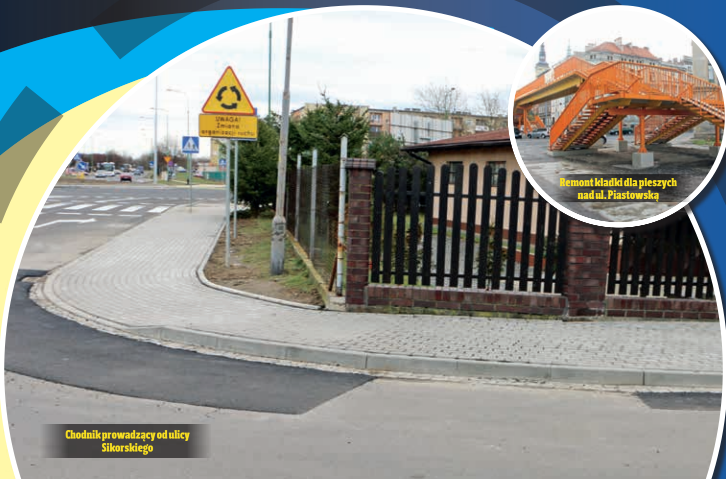
Chodnik prowadzący od ulicy Sikorskiego