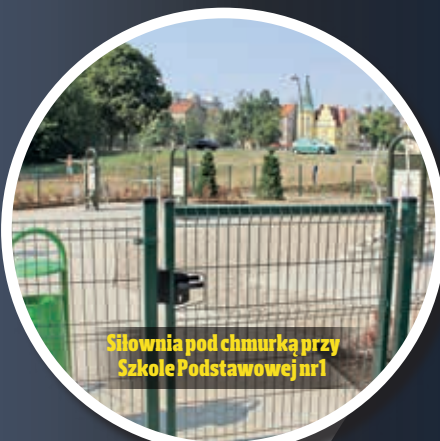
Siłownia pod chmurką przy Szkole Podstawowej nr 1