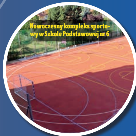
Nowoczesny kompleks sportowy w Szkole Podstawowej nr 6

Salę lekcyjną przebudowano na nowoczesną pracownię analizy chemicznej – koszt około 86 tys. zł.