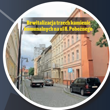
Rewitalizacja trzech kamienic komunalnych na ul. Pobożnego