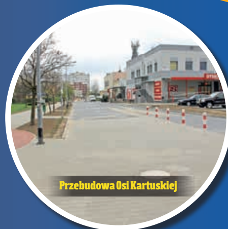
Przebudowa Osi Kartuskiej