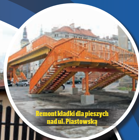
Remont kładki dla pieszych nad ul. Piastowską