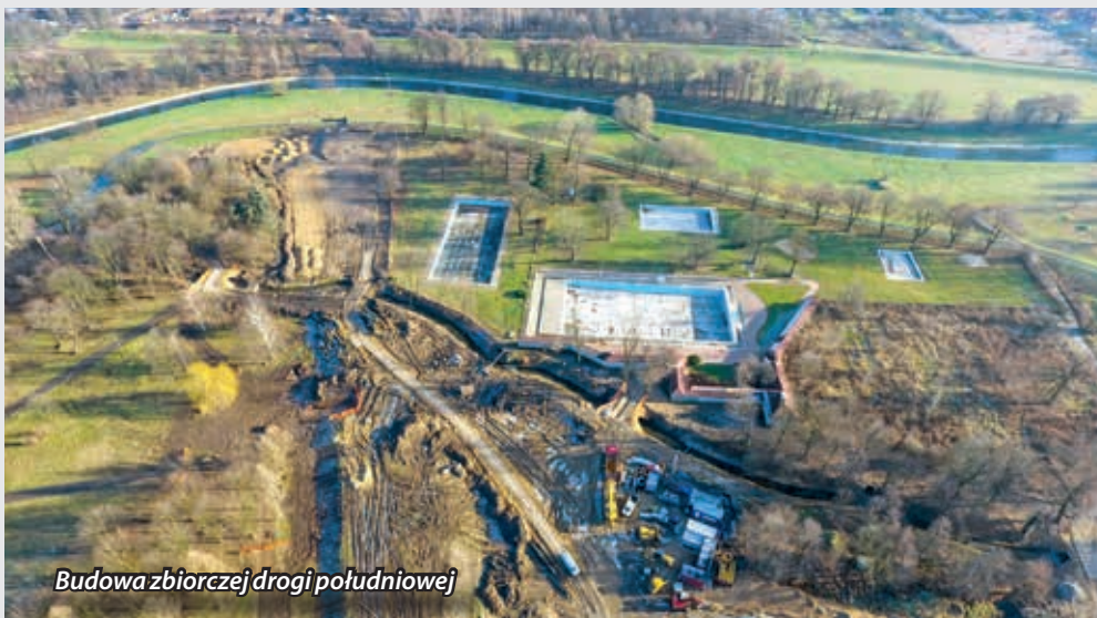
Budowa zbiorczej drogi południowej

Zawsze chciałoby się więcej. Cieszymy się zaletami naszego miasta. W Legnicy mieszka się naprawdę dobrze, a przy tym widać gołym okiem potężny postęp niemal w każdej dziedzinie życia. Zapraszam do rozmowy na ten i inne tematy ezielinska@legnica.eu .