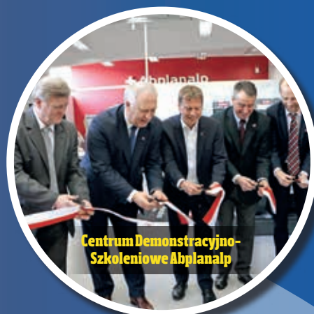
Centrum Demonstracyjno-Szkoleniowe Abplanalp