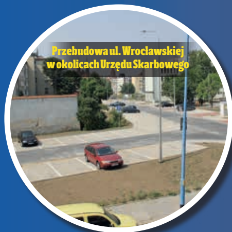
Przebudowa ul. Wrocławskiej w okolicach Urzędu Skarbowego

Ulica Wrocławska została gruntownie przebudowana na odcinku od skrzyżowania z ul. Kazimierza Wielkiego do skrzyżowania z Czarnieckiego, przebudowano też ul. Kazimierza Wielkiego na odcinku od skrzyżowania Wrocławskiej do Czarnieckiego. Plac Sybiraków rozciąga się na obszarze ponad półtora tysiąca metrów kwadratowych.