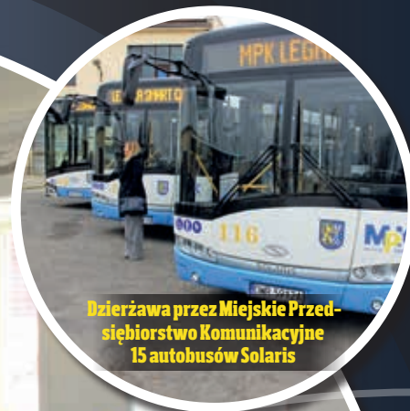
Dzierżawa przez Miejskie Przedsiębiorstwo Komunikacyjne 15 autobusów Solaris