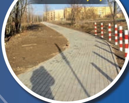
Chodnik na osiedlu Drzymały

Zerwana została stara, zniszczona i pokruszona nawierzchnia. Zastępuje ją nowa, z kostki betonowej i kamiennej. Koszt ok. 24,5 tys. zł.