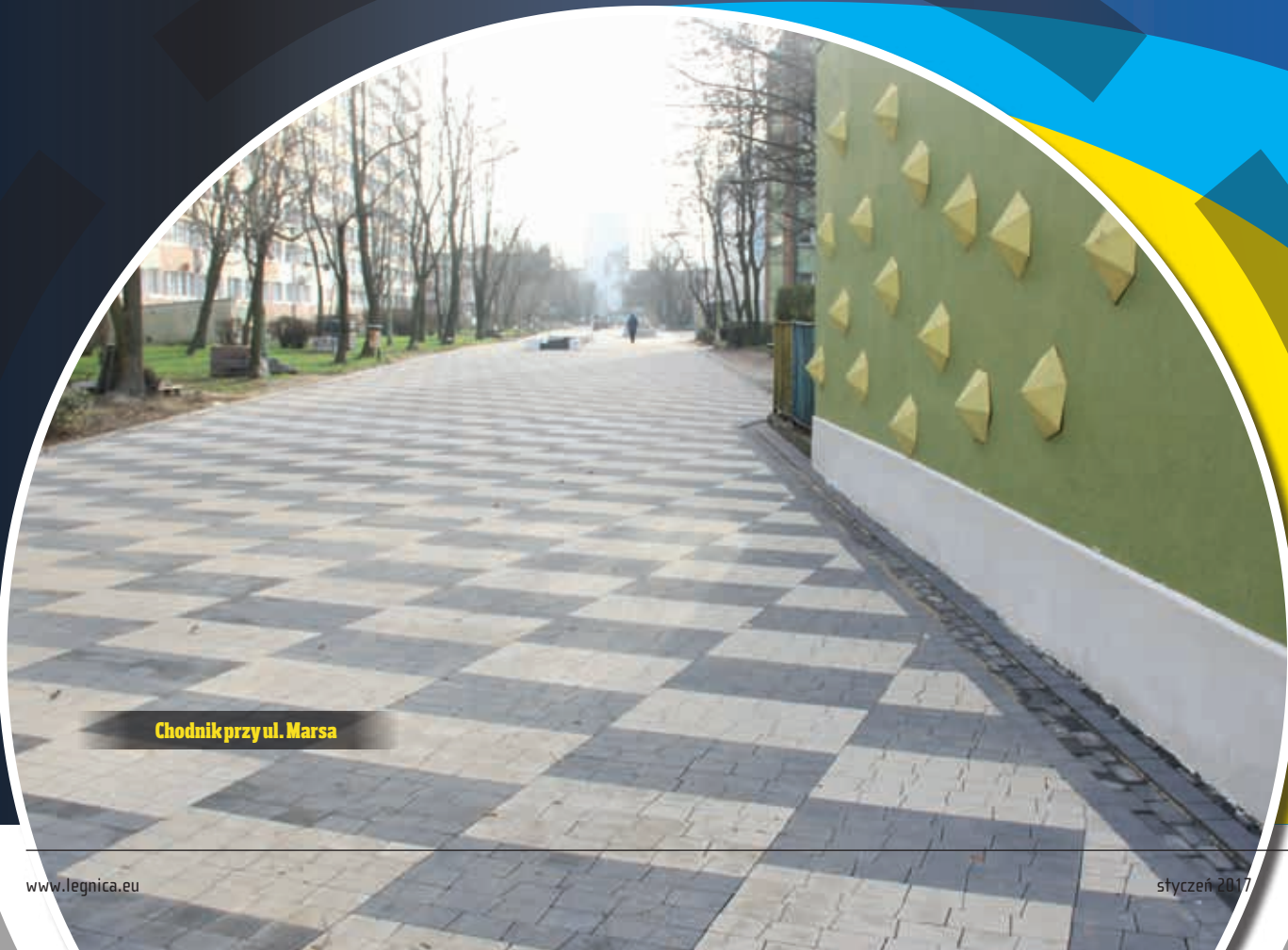
Chodnik przy ul. Marsa

W ramach tego zadania zainstalowano 23 latarnie nawiązujące swoją stylistyką do zabytkowej zabudowy dzielnicy. Zdemontowane zostaną lampy wiszące na linach bezpośrednio nad jezdnią. Koszt ok. 302 tys. zł.