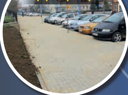
Chodnik i parkingi przy ul. Marynarskiej

Deptak tworzy efektowną wizualnie szachownicę z kostki betonowej. Było to wspólne przedsięwzięcie Zarządu Dróg Miejskich i Legnickiej Spółdzielni Mieszkaniowej. Koszt zadania wyniósł 80 tys. zł.