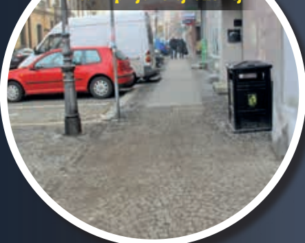
Chodnik przy ul. Chojnowskiej

Zakres prac obejmował wymianę asfaltowej nawierzchni chodnika na płyty i kostkę kamienną, płyt betonowych na kostkę kamienną oraz wjazdu w ul. Bankową na kostkę kamienną. Dodatkowo wymieniono fragment wyeksploatowanej nawierzchni asfaltowej. Dzięki tej inwestycji nawierzchnia nawiązuje do zabytkowego charakteru śródmieścia. Koszt to ok. 179 tys. zł.