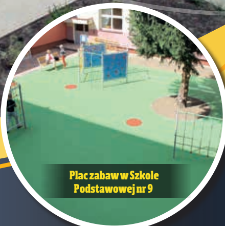
Plac zabaw w Szkole Podstawowej nr 9

W podwórzu przy ul. Żwirki i Wigury zamontowane zostały urządzenia do ćwiczeń: biegacz, orbitrek, drabinka pionowa, podciąg nóg, surfer, wahadło, twister, prasa nożna, wioślarz i wyciąg górny. A także ławki, kosze na śmieci, zasadzono drzewka i krzewy. Zbudowano chodniki z kostki brukowej.