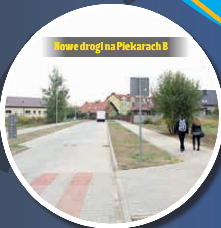
Nowe drogi na Piekarach B