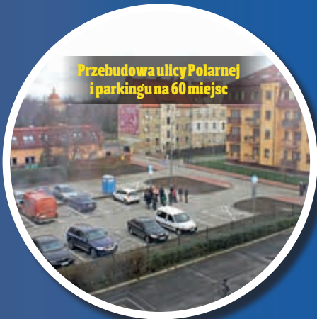
Przebudowa ulicy Polarnej i parkingu na 60 miejsc