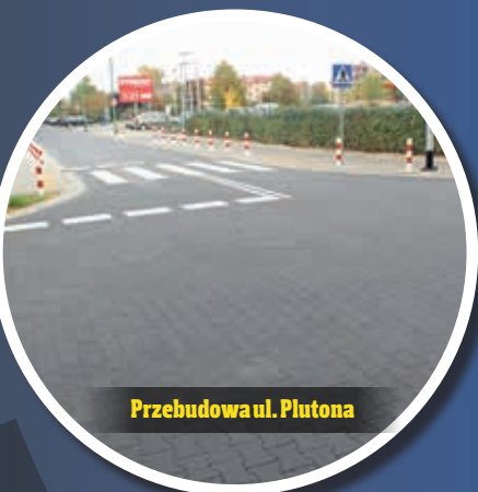
Przebudowa ul. Plutona