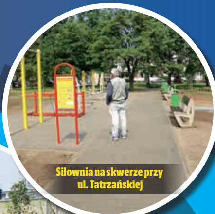
Siłownia na skwerze przy ul. Tatrzańskiej

Teren rekreacyjny powstał w sąsiedztwie zbudowanego w minionym roku (w ramach pierwszej edycji LBO) placu zabaw. Zbudowano teraz ścieżki, ustawiono drewniane leżaki, ławki, kosze na śmieci, także stół do gier planszowych. Posadzono kilkuletnie drzewa.