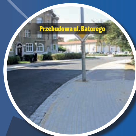
Przebudowa ul. Batorego