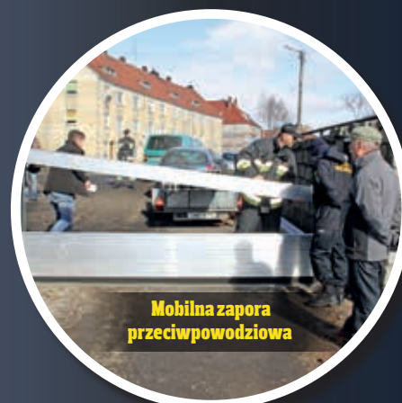
Mobilna zapora przeciwpowodziowa

Zarząd Gospodarki Mieszkaniowej przekazał wspólnotom mieszkaniowym ponad 3,5 mln zł, w zdecydowanej większości na fundusz remontowy.