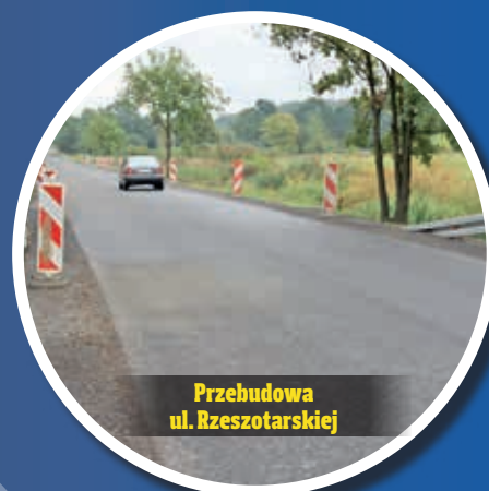
Przebudowa ul. Rzeszotarskiej

Wymieniono uszkodzoną nawierzchnię betonową oraz z płyt betonowych na nową kostkę. Ułożono nowy krawężnik betonowy. Koszt ok. 24,5 tys. zł.