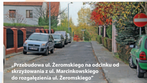
„Przebudowa ul. Żeromskiego na odcinku od skrzyżowania z ul. Marcinkowskiego do rozgałęzienia ul. Żeromskiego”

Na przygotowanie dokumentacji projektowo-kosztorysowej zadania „Przebudowa ul. Żeromskiego na odcinku od skrzyżowania z ul. Marcinkowskiego do rozgałęzienia ul. Żeromskiego” wpłynęło 5 ofert. Najkorzystniejszą (8.610,00 zł brutto) złożyła lubińska firma Usługi Projektowe „Bipropmar”.