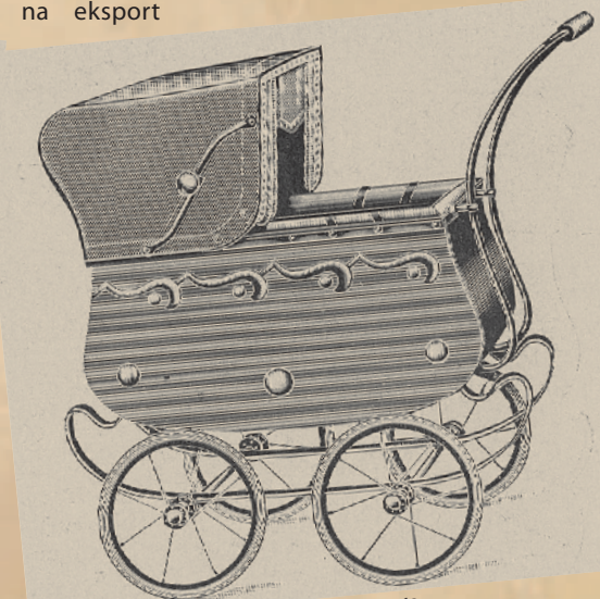
Wózek dla lalek firmy Mummerta.

się spółdzielnie pracy. W styczniu 1948 r. powstała Spółdzielnia Pracy „Mechanik”. Wiodącą jej produkcją były wózki dziecięce, które przez krótki okres trafiały na eksport