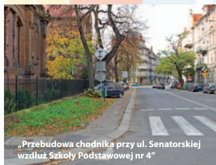
„Przebudowa chodnika przy ul. Senatorskiej wzdłuż Szkoły Podstawowej nr 4”

wając z dwoma innymi, opracuje też dokumentację na przebudowę chodnika przy ul. Senatorskiej wzdłuż SP 4. Cena usługi wyniesie 6.094,65 zł brutto.