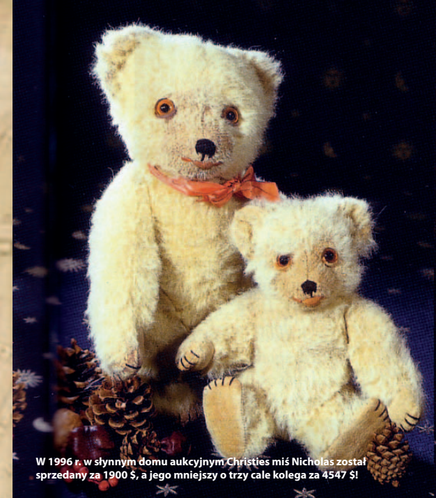
W 1996 r. w słynnym domu aukcyjnym Christies miś Nicholas został sprzedany za 1900 $, a jego mniejszy o trzy cale kolega za 4547 $!

W powojennej historii miasta produkcją zabawek i sprzętu dziecięcego zajmowały