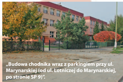
„Budowa chodnika wraz z parkingiem przy ul. Marynarskiej (od ul. Lotniczej do Marynarskiej, po stronie SP 9)”.

Legnicka Firma Usługowo-Handlowa „Termont” opracuje dokumentację na zadanie „Oświetlenie ulicy” – wykonanie oświetlenia przy budynku Okrężna 17-19-21. Zamontowanie lamp oraz przebudowa chodnika. Była to jedyna oferta, opiewająca na kwotę 9.963,00 zł brutto.