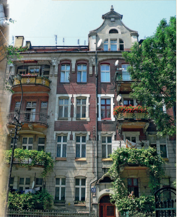
Roosevelta to jedna z najpiękniejszych ulic w Legnicy

Aż do drugiej połowy XIX w. obszar leżał poza administracyjnymi granicami miasta. Ostatecznego jego przejęcia, po uregulowaniu kwestii spornych z sąsiednimi gminami, dokonano w 1873 r. Tarninów został otwarty dla gospodarczej, a szczególnie budowlanej ekspansji bogacącego się legnickiego mieszczaństwa. Budownictwo mieszkaniowe jedno- i wielorodzinne rozwijało się pod koniec XIX w. we wszystkich kierunkach, wzdłuż głównych wylotowych dróg. Dawne trakty prowadzące do Jawora i Złotoryi stały się punktami wyjścia dla założeń nowej dzielnicy. W jej obrębie wyłoniły się dwa zespoły: większy – pomiędzy ulicami Złotoryjską i Jaworzyńską oraz mniejszy – pomiędzy Jaworzyńską i Mickiewicza aż po granice parku. Zespół mniejszy zabudowano do dzisiejszej ulicy Oświęcimskiej. Większy sięgał znacznie bardziej na południe, aż do dzisiejszej al. Zwycięstwa.