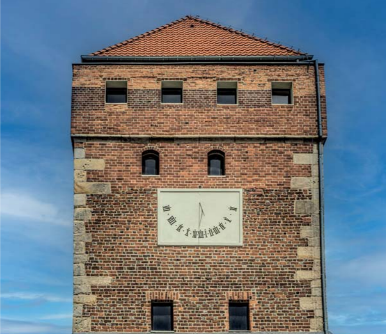
● Wieża Bramy Głogowskiej