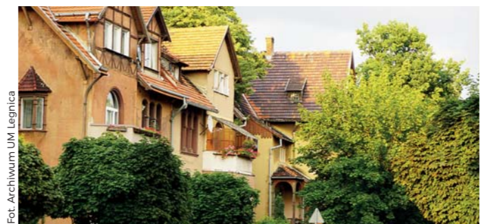
● Zabytkowe wille na Tarninowie

W latach 1945-1993 znajdował się tutaj całkowicie niedostępny dla Polaków tajny kompleks, dowództwo oraz kwatery oficerów Północnej Grupy Wojsk Armii Radzieckiej. Lokalizacja przy ul. Grunwaldzkiej była prawdopodobnie związana z istnieniem w tym miejscu, nowoczesnego sztabu dowództwa 18. Dywizji Piechoty Wehrmachtu, wybudowanego w 1938 r.