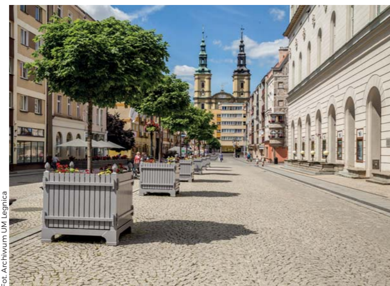
● Duży Rynek z barokowym Starym Ratuszem oraz Śledziówkami