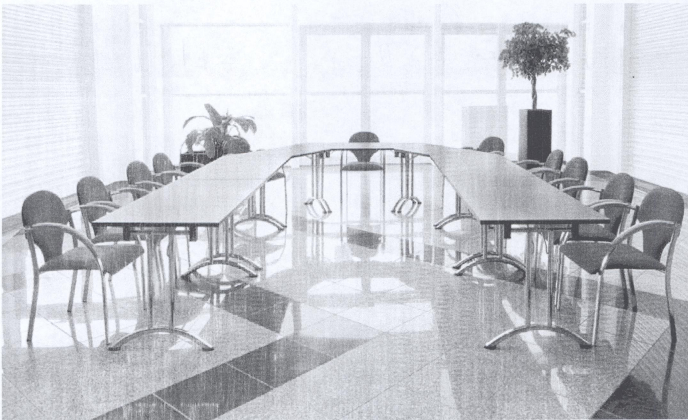
Stoły Domino-25 i krzesła Spagna.