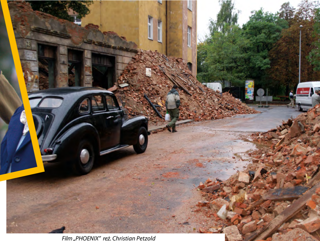
Film „PHOENIX” reż. Christian Petzold