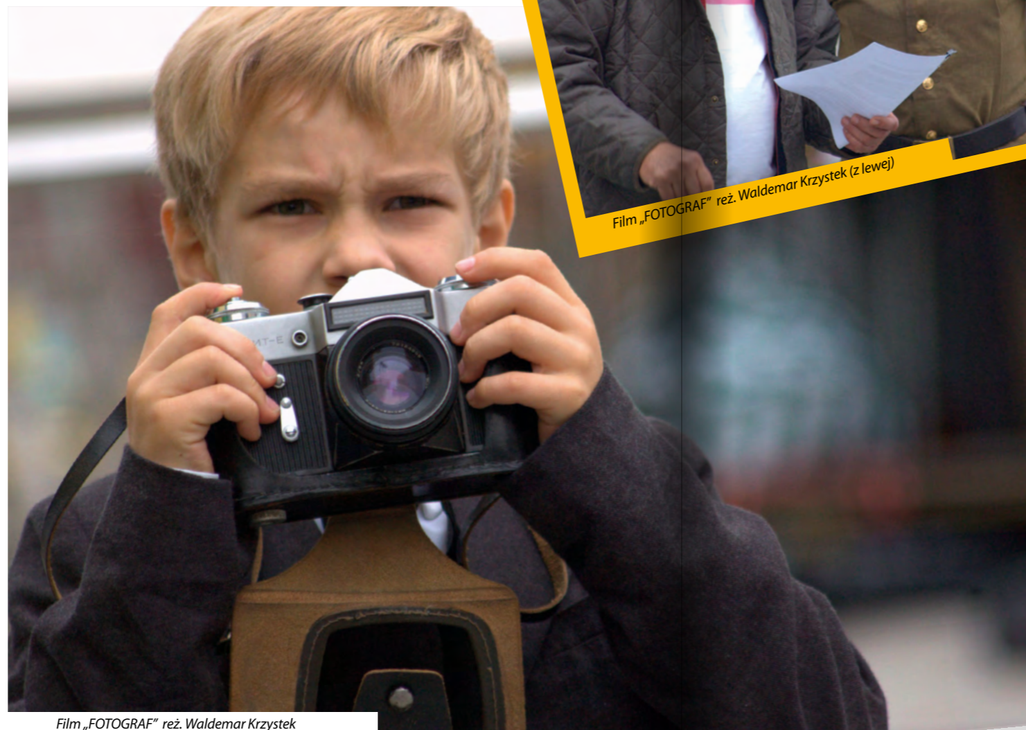
Film „FOTOGRAF” reż. Waldemar Krzystek

Nelly w końcu odnajduje Johanna, ale on jej nie rozpoznaje. Mimo to nawiązuje z nią znajomość. Widzi w niej podobieństwo do „zmarłej” żony i składa jej propozycję. „Nieznajoma” kobieta ma odegrać rolę Nelly po to, żeby otrzymać ogromny spadek, który odziedziczyła po swojej rodzinie. Nelly zgadza się, staje się własnym sobowtórem. Chciałaby się dowiedzieć, czy Johannes kiedykolwiek ją kochał i czy ją zdradzał. Chce odzyskać utracone życie. Im bardziej upodabnia się do „zmarłej”, tym bardziej rozpaczliwe i irytujące stają się relacje „byłych” małżonków.