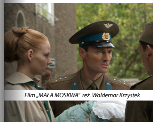
Film „MAŁA MOSKWA” reż. Waldemar Krzystek

W Legnicy realizowany był klimatyczny film „Przebaczyć” w reżyserii Marka Stacharskiego. Nasze miasto jako plener filmowy upodobał sobie rodowity legniczanie - Waldemar Krzystek. Tu powstał