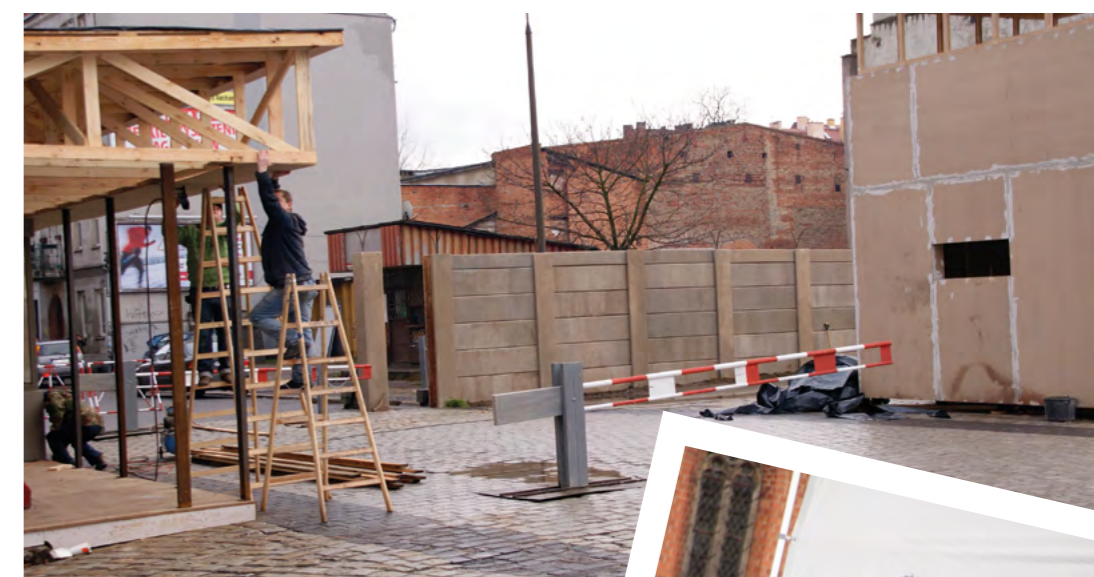
Film „JACK STRONG” reż. Władysław Pasikowski